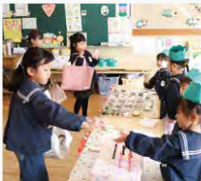
お店屋さんごっこ