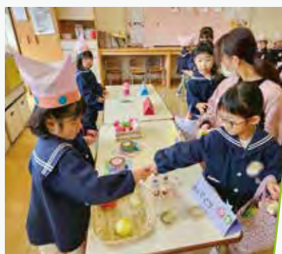
お店屋さんごっこ