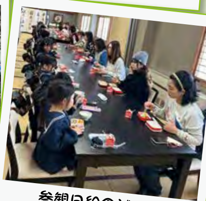
参観日給食試食会